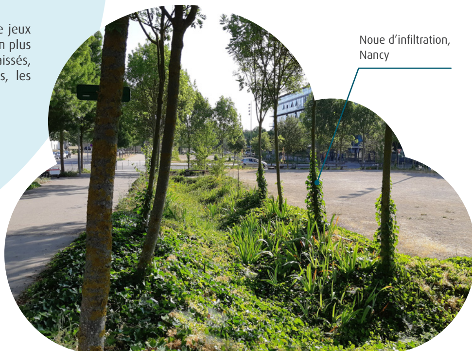
Noue d'infiltration, Nancy